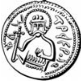
Срібник Володимира Святославовича

чатку 1853 р. до цього ж музею надійшло ще 28 ніжинських давньоруських срібників. Ймовірно це були якраз ті, котрі збирався подарувати імператорові П.І. Гессе. Як бачимо їх значно більше, ніж 5 монет, – можливо в такий спосіб, збільшивши обсяг подарунку, чернігівський губернатор намагався реабілітуватися за втрачений на початку вересня шанс продемонструвати свою вірність імператорові.