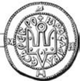
Срібник Ярослава Володимировича