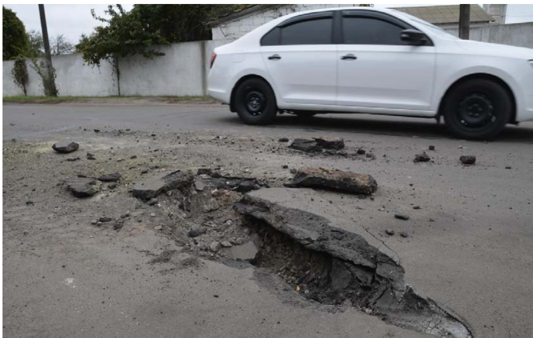
Воронка від снаряду на вулиці Дрофаня. Ічня.