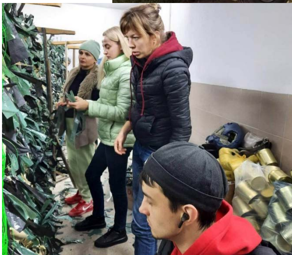
Волонтери за роботою в гаражі водоканалу. Ічня, осінь 2022.