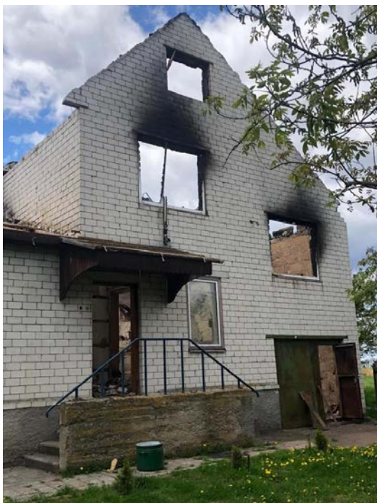
Спалений будинок на околиці села Бакаївка