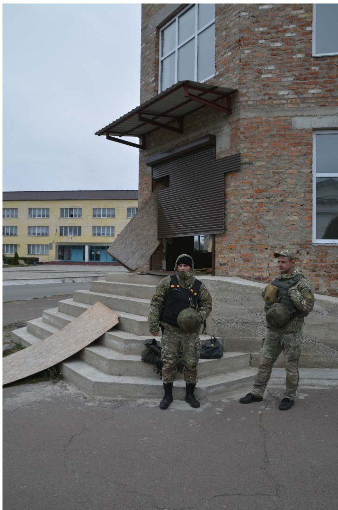
Патрулювання центру Ічні. Жовтень 2018 р.