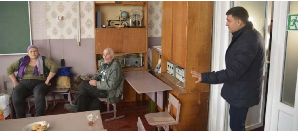
Прем'єр-міністр Володимир Гройсман 9 жовтня у Парафіївській школі, яка прийняла евакуйованих