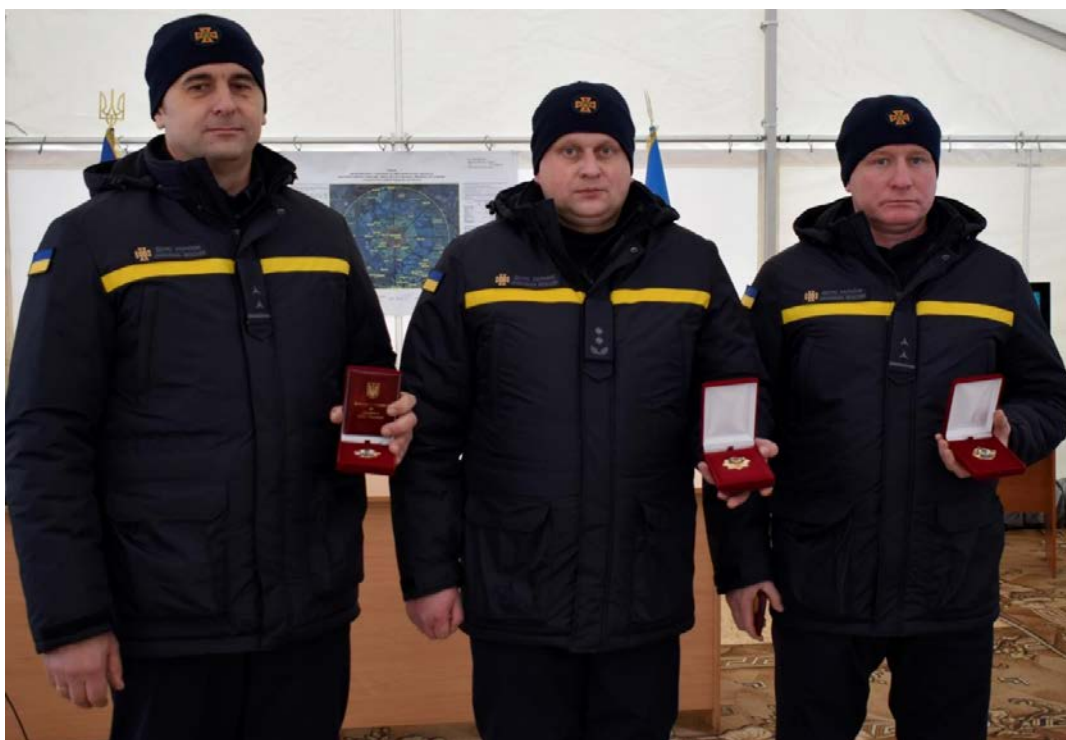
Нагорода за небезпечну працю