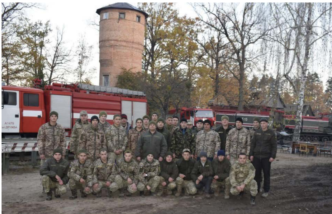
Пожежна рота військової частини в смт. Дружба