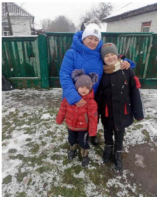
Переселенці з Маріуполя