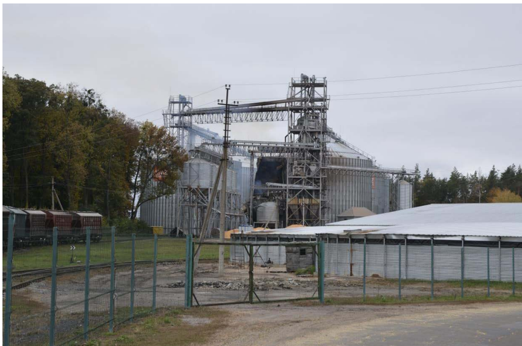
Пошкоджена сушарка. Ічня, елеватор «Інтера». Її пожежу дехто з ічнянців сприйняв як пожежу залізничного вокзалу або маслозаводу.