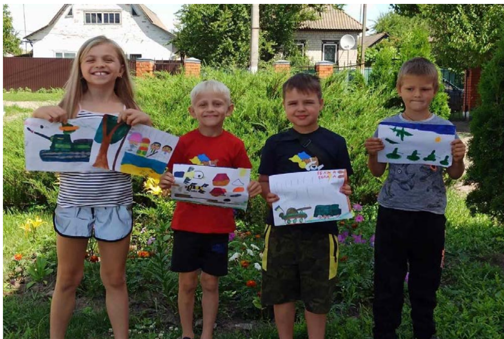
Дитяча допомога для Збройних сил України