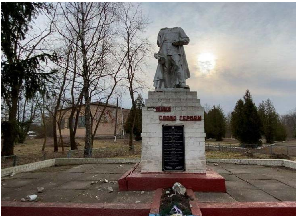
Пошкоджені пам'ятники в селі Мартинівка