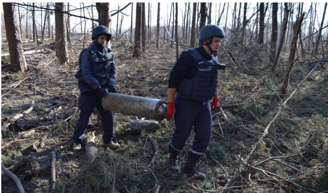
Розмінування. Піротехніки за роботою. Листопад-грудень 2018 р.