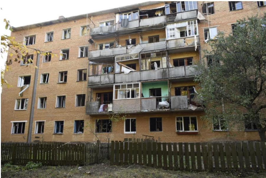
Пошкодження багатоквартирного будинку в смт Дружба. 9 жовтня 2018 р.