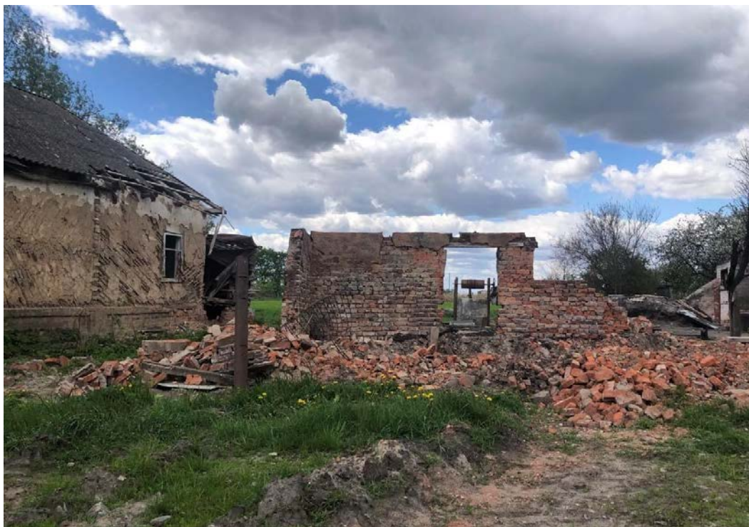
Руїни будинків у селі Комарівка. Квітень 2022 р.