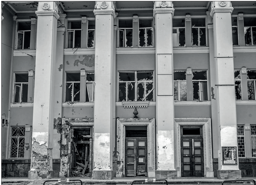
Пошматований центр міста. Головоштамт.

Ще нам дали два консервованих салати, печива та якісь солоні палички дітям. Я ніколи не любила ті овочеві салати. А ось тепер їм із задоволенням. Дякую свекрусі, яка те все закривала влітку.