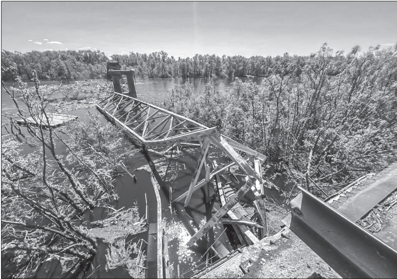
Залишки знищеного автомобільного мосту на дорозі Київ - Чернігів

Розбомблена, понівечена залізна конструкція.