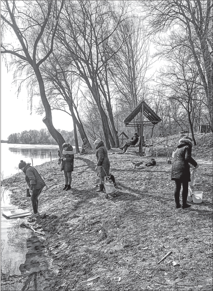
Чернігівці набирають воду прямо з Десни