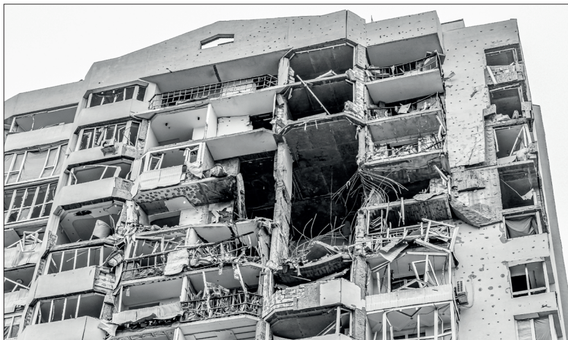
Пряме влучення російської бомби

Н іжно-рожева Катрусина курточка зовсім брудна. Не можу випрати. Потрібен цілий день, щоб висохла. Не маю стільки часу. Раптом сирена і треба бігти, а