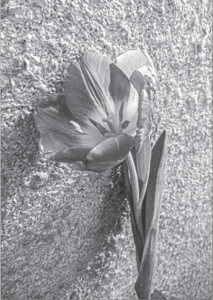
Квіти на війні