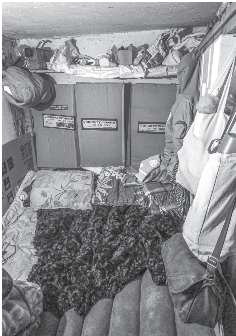
Наш прихисток під час війни