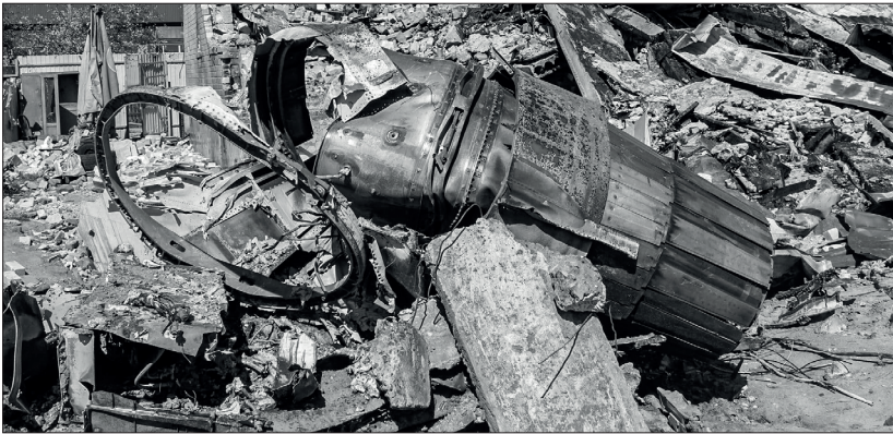
Залишки збитого 5 березня російського Су-34

Не можу більше про це лайно писати. В мене немає слів, щоб описати всю свою ненависть.