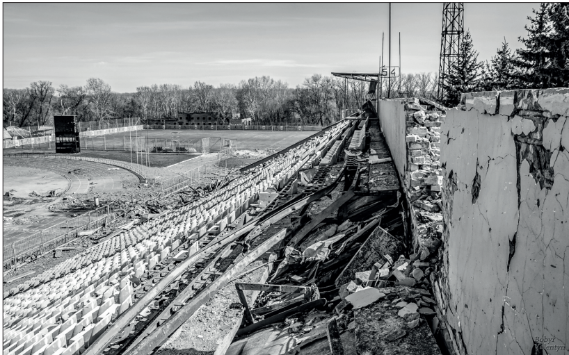
Стадіон імені Гагаріна

Не знаю, як і що варити далі. Води нема. Місцева влада знову обіцяє виправити цей колапс. Та результатів поки нема.