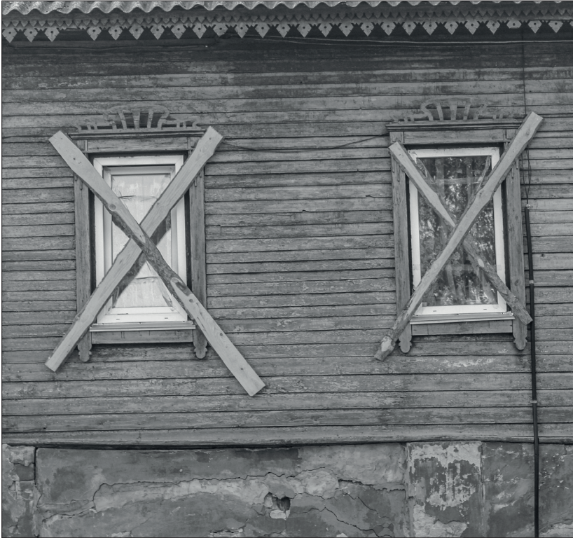
Реалії воєнного Чернігова

Вночі не стріляли, але ми боялись йти додому.