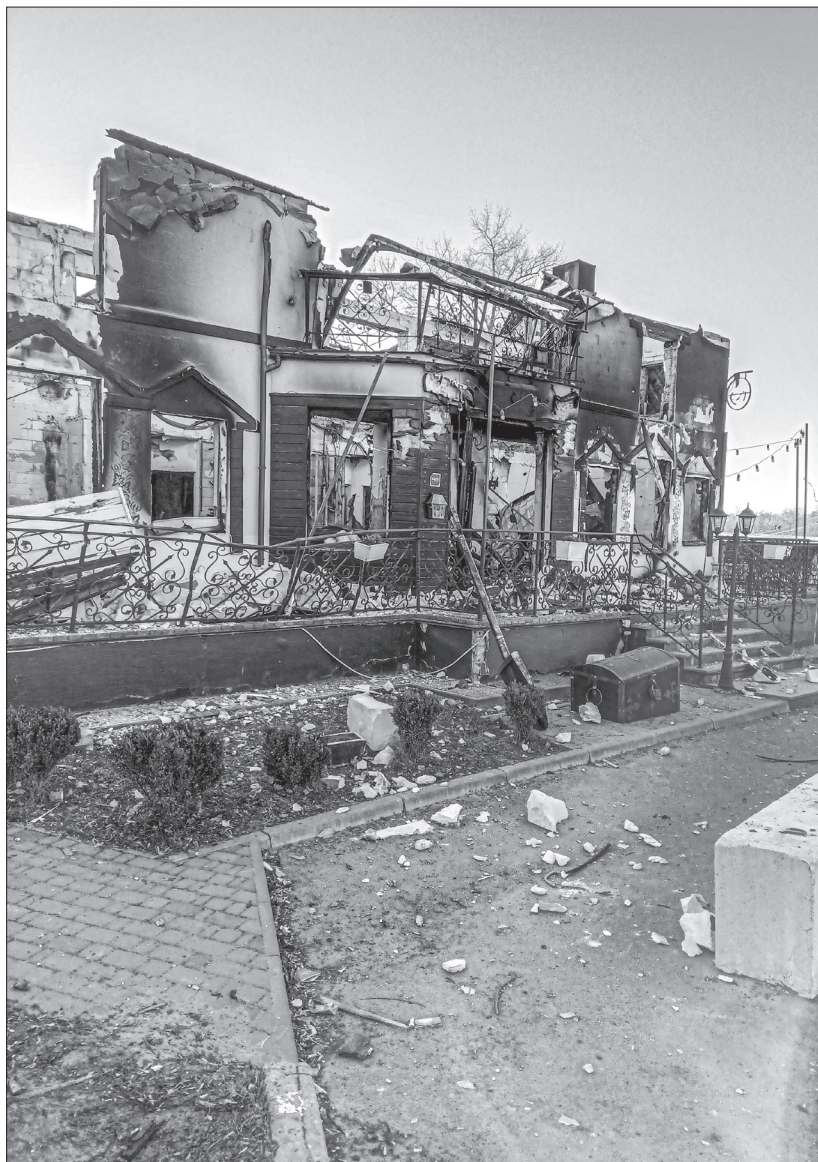
Спалений ресторан «Губернія»