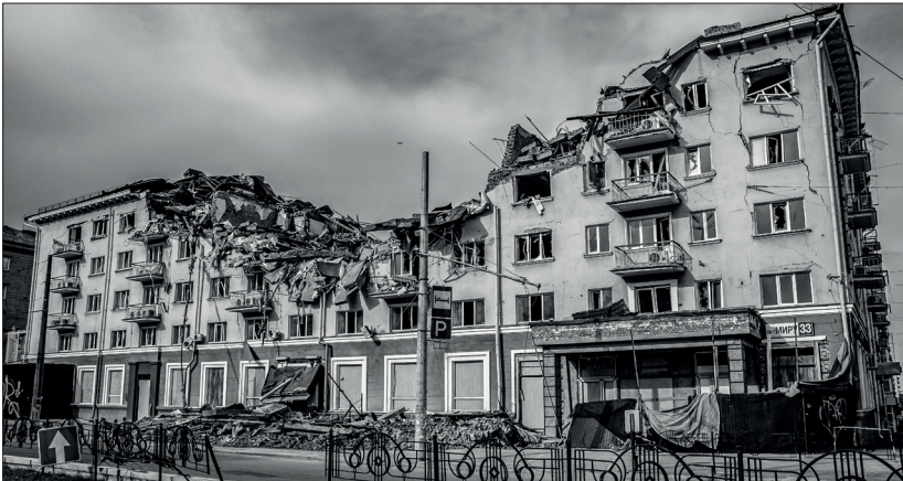
Готель «Україна» після ракетного удару

Цілий день були вдома. Стан у всіх пригнічений. Я вже не плачу. Трохи заспокоїлась.