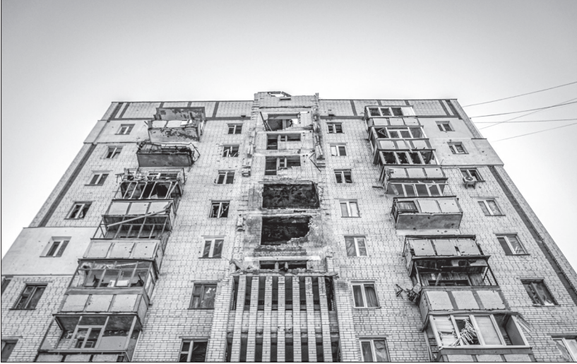
Прикмети війни