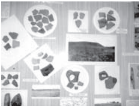
Експонати в Буринському районному краєзнавчому музеї