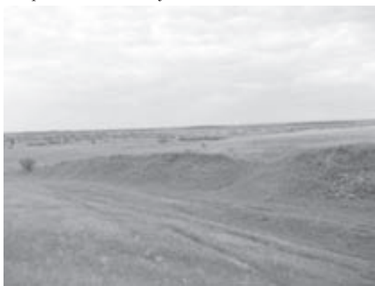
Старовинний шлях біля с. Шилівка

З цих місць дуже добре видно Путивль (відстань 17 км), особливо Молчанський монастир виглядає на горизонті як біле вітрило. Через цю місцевість пролягав транспортний шлях з Путивля до Ромен.