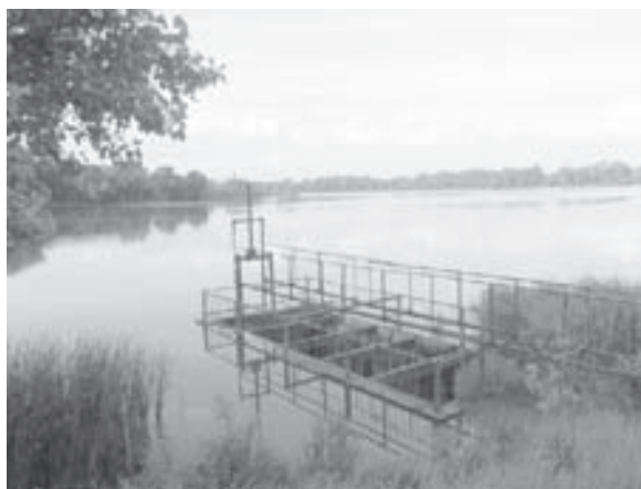
Річка Чаша в центрі міста Буринь

Як відомо, повноводна й екологічно чиста річка Чаша, конфігурація якої подібна чаші (тож і назва виникла від слова праукраїнської мови «чаша», з інших джерел – запозичена від назви озера Чаша. – Авт.), була тією життєдайною силою, що сприяла масовому розселенню людей на її берегах в різні історичні часи.