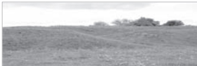
Урочище Валки біля села Миколаївка