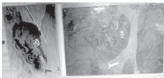
План розкопаного могильника в селі Успенка

Окрім черняхівського поселення в с. Успенка, з публікації у виданні «Археологічні відкриття 1986 року» дізнаємося про виявлене черняхівське поселення у селі Чумаково. На краю села біля дороги, що веде в Червону Слободу, знаходиться Ослецьке (Оселецьке) городище, назване так по імені рукава Оселець [3]. Ця місцевість була зручною для поселенців: вода, сінокоси, риба – навколо річки: Сейм, Чаша, озеро Оселець.