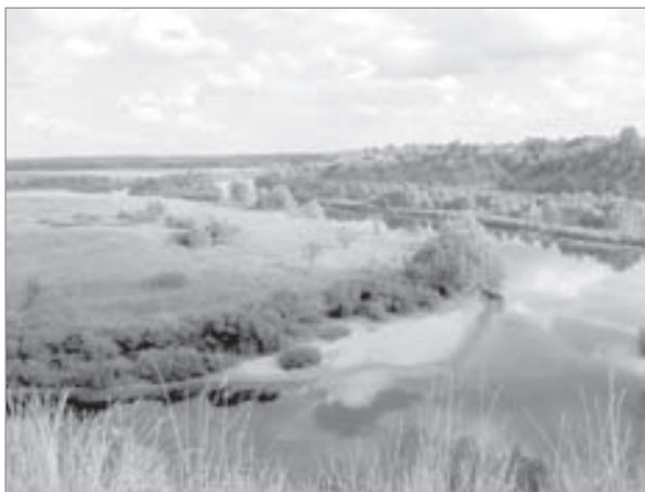
Заплава річки Сейм. Село Ігорівка

Реліктовний ліс (споконвічний), який зберігався довгий час і недоторканий людською рукою. Ратмир (богатир) – це слов'янське ім'я. За два кілометри на захід від Ратмирової діброви побудовано літописне місто – укріплення В'ехань. Біля Ратмирової діброви постійно несли свою важку розвідку-охорону воїни севрюки. На території Сніжківської сільської ради Буринського району є урочище Гусаків Гай – Реліктовний ліс. Сірі лісові ґрунти свідчать про те, що біля Сніжків міг бути відрізок Ратмирової діброви.