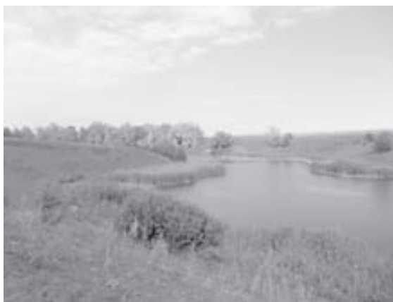
Городок. Околиці м. Буринь

Цікава місцевість на притоці річки Чаша під назвою Городок («Городище»). Урочище називається Колотяга. На цій території було стародавнє поселення. Свідченням цього є археологічні знахідки: кераміка, монети періоду Київської Русі.