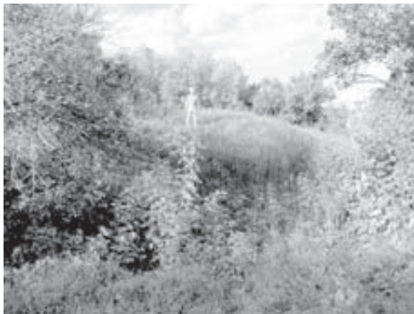
Городище с. Ігорівка

північніше цієї водної артерії, та, власне, сама столиця князівства – Новгород-Сіверський на Десні.